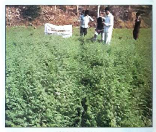
Field of gram