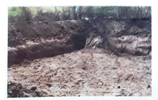
Excavation of farm pond

સરેરાશ ૧૮૦૦ મીમી વરસાદ પડતો હોવા છતાં ગામમાં શિયાળ પાકો માટે પિચતના કોઇ સ્પ્રોત નથી. તેથી વાતાવરણીય પડકારને પહોંચી વળવા માટે ચોમાસાની ગુદુતુમાં વરસાદી પાણીનો સંગ્રહ કરવો અને તેનો ઉપયોગ ચોમાસામાં સૂકા સમયગાળામાં અને શિયાળુ ગ્લુતુ માટે કરવો એ જ ઉત્તમ ઉપાચ છે. કેવીકેએ ખેડુતોને ખેત તલાવડી બનાવીને વઢી જતા પાણીનો સંગ્રહ કરવા તરક વાળ્યા. ઢોળાવવાળી જમીન પર ખેત તલાવડી ખોદવામાં આવી જેથી વધુમાં વધુ પાણીનો સંગ્રહ થઇ શકે. કુલ ૧૩ ખેડૂતોના ખેતરે 30x30x0 ફ્ટના માપની કુલ ૩૧ ખેત તલાવડી બનાવવામાં આવી. દરેક ખેત તલાવડી ને ૪૨૫ જીએસએમ એચડીપીઇ પ્લાસ્ટિકથી કવર કરવામાં આવી. એક ખેત તલાવડીની સમતા એક સાથે અંદાજે ૧,૮૦,૦૦૦ લિટર પાણીનો સંગ્રહ કરવાની છે. એક ખેત તલાવડી ખોદવા તથા પ્લાસ્ટિક કવર સાથેનો કુલ ખર્ચ રૂ. ૨૫,૦૦૦/-થયો. જેમાં દરેક લાભાર્થી ખેડુતે રૂ. ૩,૦૦૦ /- નું ચોગદાન આપેલ. દરેક ખેત તલાવડી ચોમાસાની ૠુતુમાં વરસાદી પાણીથી પુરેપુરી ભરાઇ ગઇ. અંદાજે ૦.૨૫ હે. પાકનો વિસ્તાર ચોમાસામાં સુકા સમયગાળા દરમ્યાન પિચત કરવામાં આવ્યો. ખેડુતોએ સંગ્રહિત પાણીનો ઉપયોગ કરીને દૂધી, કારેલા તથા ધાણા, મેથી જેવા દુંકા ગાળાના પાકો લેવાનું શરૂ કર્યુ. પરકોલેશન ટાંકીના કારણે આજુબાજુના કુવા પણ રિચાર્જ થયા. ખેકુતો હારા સૂક્ષ્મ પિચત પધ્ધતિ અપનાવીને ઘણો વિસ્તાર પાક હેઠળ આવરી લેવામાં આવ્યો.