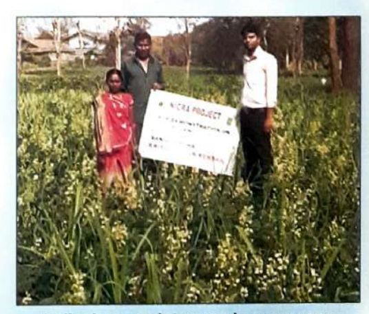
Indianbean as intercrop in sugarcane