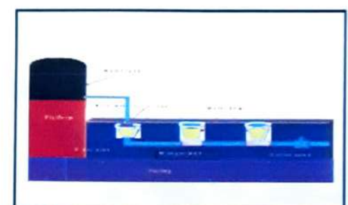
Design of automatic water system

યોગ્ય ઉચાઇએ ગોઠવેલ ટાંકીમાંના સંગ્રહિત પાણીને ગુરુત્વાક્ષ્વંણથી કંટ્રોલ વાલ્વથી એક ઇંચના પીવીસી પાછપ દ્વારા પશુ આગળ ગોઠવેલ બાઉલ સુધી સતત પાણીની ઉપલબ્ધિ અંગેની તાંત્રિક્તાનો કેવીકે દારા પ્રસાર કરવામાં આવેલ છે. પાછપનો એક છેડો બાઉલ પર અને પાણીનં લેવલ મેળવીને બીજો છેડો ટાંકીના કંટ્રોલ વાલ્વ સાથે જોડવામાં આવે છે. બે પશુના વચ્ચે એક પ્રમાશે પાશી પીવાના બધા જ બાઉલ એક સરખા અંતરે ગમાણની દિવાલે એક સરખી ઉચાઇએ ફીટ કરવામાં આવે છે. વધુમાં વધુ ૧૦ બાઉલ એક સાથે પાણીના કંટ્રોલ વાલ્વ સાથે જોડાઇ શકે છે જેથી વધુમાં વધુ ૨૦ પશુઓને એક સાથે પાણીની સુવિધા ઉપલબ્ધ થઇ શકે છે. ગુરુત્વાકર્ષણના સિદ્ધાંત મુજબ પાણીનો પ્રવાદ ઉચાઇએ રાખેલ ટાંકીમાંથી નીચે તરફ વહેતાં બાઉલ આપમેલે ભરાઇ જાય છે. આ રીતે ૨૪ કલાક ચોખ્ખા પાણીની ઉપલબ્ધતાથી પશુ જ્યારે ઇચ્છે ત્યારે પાણી પી શકે છે. આઉટલેટ વાલ્વ મારકતે પાણીને ખાલી કરીને પાશીના બાઉલને નિયમિતપણે સાફ કરી શકાય છે. ચાર ગાયોના યનિટ માટે આ પાણીની સુવિધા માટેનો કલ ખર્ચ રૂ. ૧૨,૦૦૦/- જેટલો થાય છે. આ સિસ્ટમમાં ૧૦૦ લિટર સમતા ધરાવતી પાણીની ટાંકી રૂ. ५/- प्रति खिटर (३. २,५००/-), छोड मास्टर वास्व साथे (३. २,५००/-), जे पाशीना जाइव (इड ग्रेड मटीरीथव) @ ३. २,०००/- (३. ૪,૦૦૦/-) અને યુપીવીસી પાછપ, ફીર્ટીંગ સામગ્રી, મજુરી, વાઢન ખર્ચ વગેરે (રૂ. ૩,૦૦૦/-). વલસાડ જીલ્લાના અંદાજે ૩૯૮ જેટલા ખેડુતોએ આ પધ્ધતિ અપનાવી છે. જેનાથી પાણીની બચત સાથે પશુ આરોગ્ચ પર ਪਈ ਗਈ ਅਸਟ ਕੀવਾ ਮਹੀ છે.