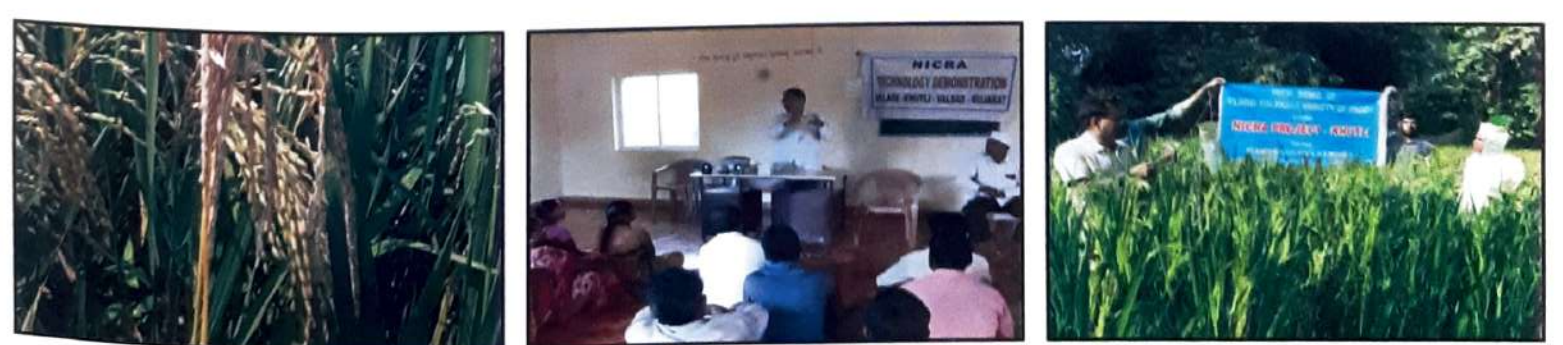
Damage of pest

કૃષિ વિજ્ઞાન કેન્દ્ર દ્વારા સંકલિત રોગ જીવાત નિયંત્રણ માટેની પર્ચાવરણપ્રિય અને ઓછા ખર્ચની તાંત્રિક્તાઓ પર ભાર મૂકવામાં આવે છે. ગામભારાની ઇચળના નિચંત્રણ માટે ધરુની ટોચને ૨-૩ સેમી જેટલી કાપીને રોપવું તથા એકમ વિસ્તાર દીઠ છોડની સંખ્યા જાળવવી જેવી નહિવત ખર્ચ ધરાવતી તાંત્રિક્તાઓ ખેડૂતો દ્વારા મોટાપાચે અપનાવવામાં આવી છે. જેનાથી ૧૦-૧૨ ટકા જેટલો ખેતી ખર્ચ પણ ધટે છે. નિકરા પ્રોજેક્ટના ગામમાં ડાંગરના પાકમાં ગાભમારાની ઇચળના નિયંત્રણ માટેના સેક્સ ફેરોમેન ટ્રેય ૧૦ નંગ પ્રતિ હેક્ટર ગોઠવવામાં આવેલ છે. ગાભમારાની ઇચળ, પાનની ઇચળો તથા ચૂસિચાના નિચંત્રણ માટે લીમડાચુક્ત દવા ૧૫૦૦ પીપીએમ ૫૦ મીલી/૧૫ લિ. પાણી પ્રમાણે છંટકાવ કરવામાં આવે છે. પાનનો સુકારો અને કરમોડી रोगना नियंत्रए। माटे सुडोमोनास कैविङ डत्यर ४० ग्राम/१० वि. પાણી પ્રમાણે આપવામાં આવે છે. સંકલિત રોગ જીવાત નિચંત્રણની આ તાંત્રિક્તાઓ અપનાવવાથી ખેડુતો રોગ જીવાત વ્યવસ્થાપનમાં સફળ થયા છે અને ઉત્પાદનમાં વધારો કરી શક્યા છે. સંકલિત રોગ જીવાત વ્યવસ્થાપનની અન્ય પધ્ધતિઓ પણ રોગ જીવાત વ્યવસ્થાપન માટે ઉપયોગી બને છે. કૃષિ વિજ્ઞાન કેન્દ્રની પ્રયોગ શાળા (PHC) માં છોડના નમૂનાઓની ચકાસણી કરી તેમજ ખેતર ઉપર રોગ જીવાતનું નિદાન કરી ખેડૂતોને સંકલિત રોગ જીવાત નિયંત્રણ પદ્ધતિઓ અપનાવવાની ભલામણ કરવામાં આવે છે જેને સારો પ્રતિસાદ મળેલ છે.