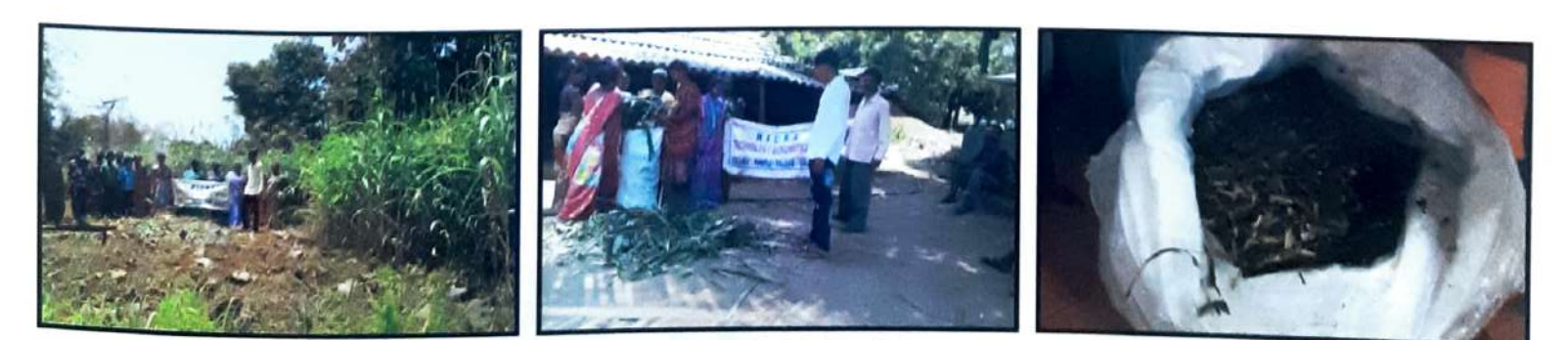
Sugargraze sorghum plot

ઉત્તમ ગુણવત્તાવાળુ સ્વાદિષ્ટ અને લીલા કે બદામી રંગનું અથાણું બનાવવા માટે એક ટન કાપેલા લીલા ચારા માટે ૧ કીલો ચૂરિયા, ૨ કીલો ગોળ, ૧ કીલો મીઠુ, ૧ કીલો મીનરલ મિક્સર અને ૧ લિટર છાસની જરૂર પડે છે. ૧૫-૨૦ લિટર પાણીમાં ચુરિયા, ગોળ, મીનરલ મિક્સર અને મીઠાનું અલગથી દ્રાવણ બનાવી તેને ચારાના ટ્રકડાઓને દબાવીને બેગમાં ભરતી વખતે સ્તર પર રેડવામાં આવે છે. સારી ગુણવત્તા ધરાવતુ અથાણું તૈયાર થતાં ૪૫ થી ૬૦ દિવસ લાગે છે. વધુ <del>કુ</del>ટ ધરાવતી, વધુ પ્રોટીન ધરાવતી અને ઓછા ઓક્ઝેલેટ ધરાવતી ચાર જાતો કો.-૪, સુગરગ્રેઝ, મલ્ટીકટ જુવાર અને બીએનએચ-૧૦ ના નિદર્શનો ખેડુતોના ખેતરે ગોઠવેલ. ખેડુતોએ આ જાતો અપનાવી છે. પછીના તબક્કામાં ખેડુતોને વધારાના લીલા ચારામાંથી અથાણું બનાવતાં શીખવ્યું. નિકરા ગામના પશુપાલકોએ કેવીકેના માર્ગદર્શન હેઠળ આ જાતોમાંથી અથાણું બનાવેલ. જેમાં બીજી જાતોની સરખામણીએ વધુ લેક્ટોઝ ધરાવતી હોઇ સ્ગરગ્રેઝ જાત ખેડુતોને પસંદ પડી. કેટલાક ખેડુતોએ આ તાંત્રિક્તા અપનાવી છે. આનાથી લીલા ઘાસચારા પર આધાર રાખવો પડતો નથી. ખેડુતો હવે લીલો અને સૂકો ઘાસચારો ચોગ્ચ પ્રમાણમાં મિશ્ર કરીને પશુઓને ખવકાવે છે. તેનાથી પશુઓની ઉત્પાદન શક્તિમાં વધારો જોવા મળે છે.